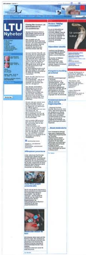
Kolumner passar bäst i tidningsdesign. På webben blir det lätt för mycket skrollande.