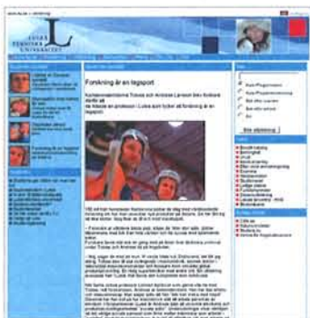
En plan för hur olika element och typer av innehåll ska hanteras saknas. Hur du ska navigera runt på sidorna är långt ifrån uppbarbart.

och intressanta artiklar om forskning och utveckling, så bra innehåll finns.