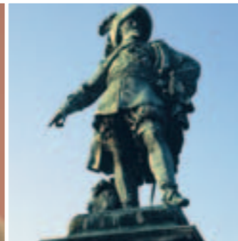
Gustav II Adolf, Göteborgs grundare